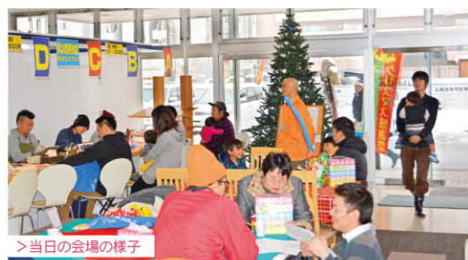
> 当日の会場の様子

イベントとしては、似顔絵師の似顔絵コーナー、七宝焼体験、手作りろうそく、マジックショー、パルーンアート、住まいるオスカーによるお住まいなんでも相談会を開催いたしました。当日は、あいにくの雪模様となり更に駐車場が狭くなりご迷惑もおかけしましたが、126組のお客様にご来場いただきました。あらためて多くのお客様に支えられている事を再認識しました。短い時間でしたが、お客様とお話出来て沢山の笑顔をいただき、社員共々楽しい時間を過ごす事が出来ました。