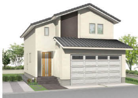
新潟県上越市 土橋モデル1