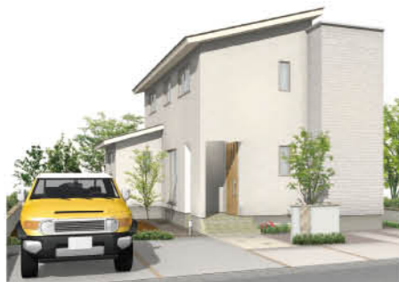
富山県射水市 射水太閤山モデル1