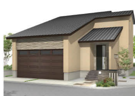
石川県金沢市 米泉モデル1