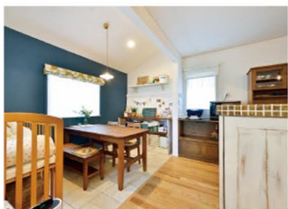
大人可愛いダイニング。