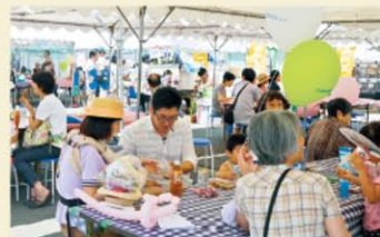
たくさんのご来場 ありがとうございました! スミカ富山