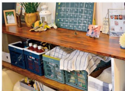
食材のトック収納棚も旦那様の手作り。キッチンの腰壁に合わせて作られました。