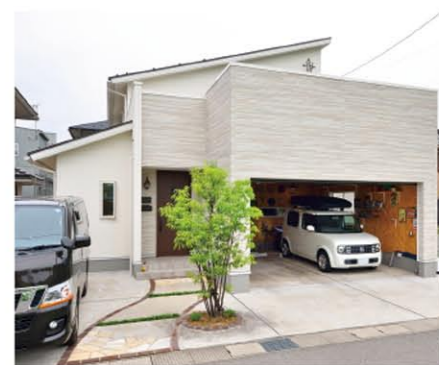
白を基調としたナチュラルな外観。