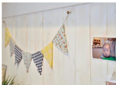
掲示板も旦那様作。思い出の写真など奥様が素敵に飾っておられます。

「夏はひんやり、冬は床暖でポカポカです。あまりに床暖が快適でタイルの上で寝てしまった事もあったんですよ」と奥様。