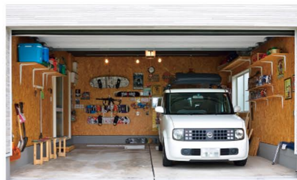
壁面には趣味の道具がセンス良く収納されています。全て旦那様が取り付けされました。