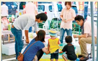
ボールすくいに挑戦!! スミカ高岡

●上越営業所 8月30日(日) ●福井地区 12月6日(日) ●石川地区 12月13日(日) ●新潟地区 12月20日(日)