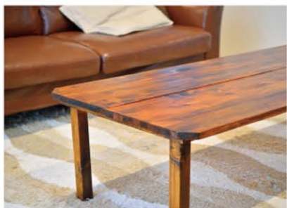
リビングテーブルは旦那様の作品。手作りと言われるまで気づきませんでした。