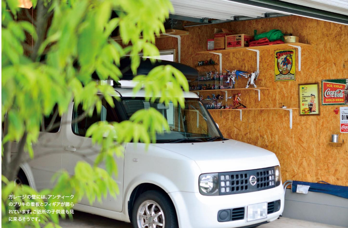
ガレージの壁には、アンティークのブリキの看板とフィギアが飾られています。ご近所の子供達も見に来るそうです。

オスカーホームの住まいを訪問し、オーナー様にお話をうかがう企画です。家は、住まう人で暮らし方と共に個性的に育つようです。家の成長と住まい方を拝見させていただきます。