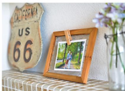
小物使いや配置など、奥様のセンスの良さを感じさせられました。