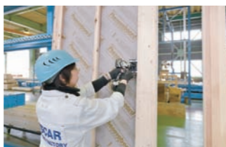
コンセントBOXの取付