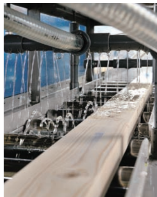
防腐・防蟻材の塗布

壁断熱材は、高性能フェノールフォーム材を使用。微細な独立気泡による高い断熱性能を発揮し、経年劣化が少なく、万が一の火災時にも炭化し、燃えにくい安全性の高い断熱材です。