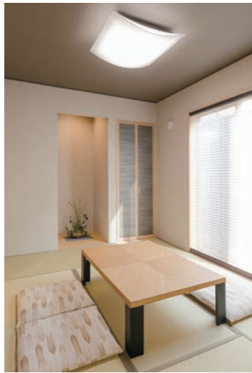
リビング横のモダンな和室。