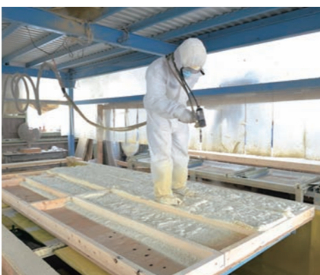
ウレタンフォーム断熱材の吹付け施工

新たな取組みとして、工場内で、床パネル及び、屋根パネルにウレタンフォーム断熱材の吹付け施工を導入しました。これに伴い、断熱欠損がなくなり、高品質で高性能なパネルの供給が可能になったのです。屋根断熱をする事で、夏場の暑い時期や冬の寒い時期でも、小屋裏と居室の温度差がなくなり、小屋裏空間が有効活用できるようになりました。