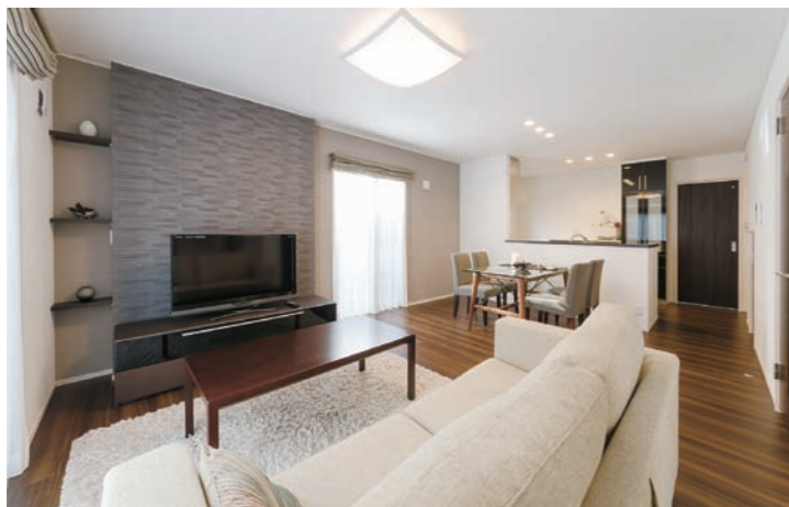
リビングのエコカラットの壁がお部屋のアクセントに。