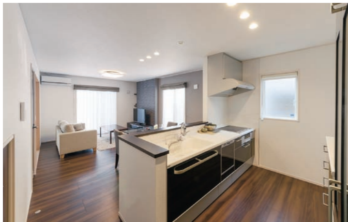
白と黒がスタイリッシュなLDK。