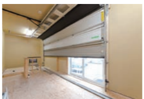
【実験の例】 ガレージドア・トーションバーの耐久実験

当工場に併設する「住まいの安心館」ではお客様に安全で安心な商品のご提供するために、経年劣化や、新商品の施工、納まり、手順を日々実施・検証しています。