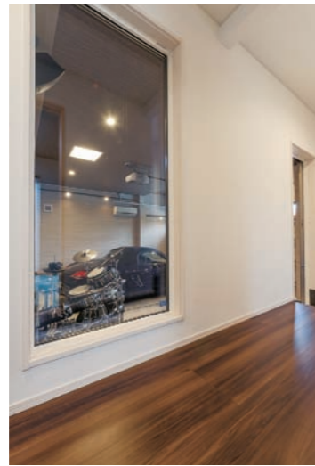
室内からいつでも愛車を眺めることができます。