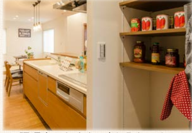
調理中でもすぐに出し入れできる 収納力抜群のキッチン横パントリー