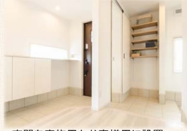
玄関を家族用とお客様に設置。 お客様用玄関はいつもすっきり!