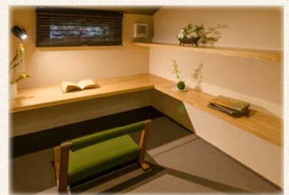
読書などの趣味を楽しむ空間に 書斎