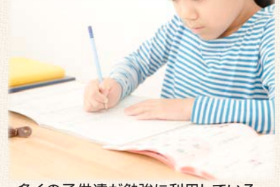
多くの子供達が勉強に利用している LDK内のカウンター!

※写真はイメージです。モデルハウスには各種オプション仕様が施されております。詳細はお問い合わせください。