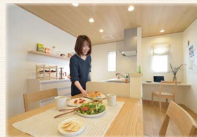
家族の様子を見ながら家事ができる 開放的なLDKとサイドダイニング

※ モデルハウスには各種オプション仕様が施されております。詳細はお問い合わせください。