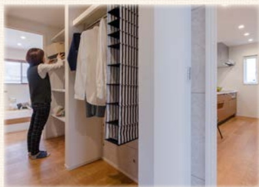
日用品や大きな物でもすっきり収納 大容量の「リビングポケット」