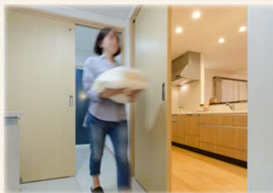
キッチンから約5歩で「洗う→干す」が 効率よく! 家事ラクな「ランドリー動線」