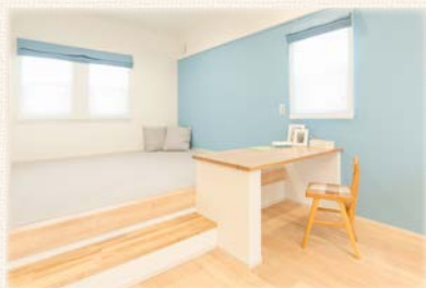
視線を合わせたコミュニケーションがとれる 対面カウンター付きの「ゴロンスペース」