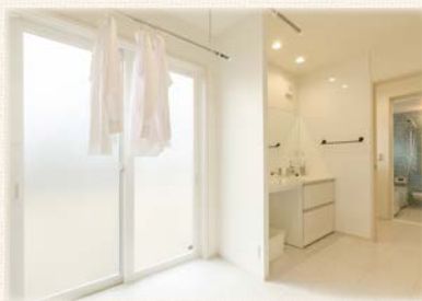
「洗う→干す→しまう」を効率よく! 家事ラクぐるっと動線♪