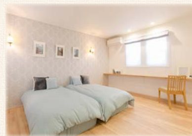
写真飾ったり、就寝前に読書を楽しんだり 主寝室には多目的に使えるカウンターを。

※ モデルハウスには各種オプション仕様が施されています。詳細はお問い合わせください。