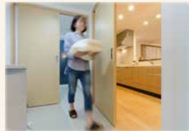
水まわりや収納が集中した 家事ラク8の字動線で家事効率UP

※写真はイメージです。モデルハウスには各種オプション仕様が施されております。詳細はお問い合わせください。