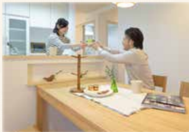
視線を合わせたコミュニケーションがとれる 対面キッチン