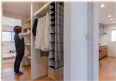
日用品や大きな物でもすっきり収納 大容量の「リビングポケット」!