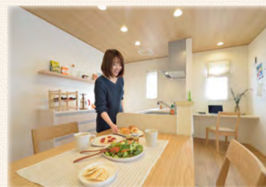
家族の様子を見ながら家事ができる 開放的なLDKとサイドダイニング

※ モデルハウスには各種オプション仕様が施されております。詳細はお問い合わせください。