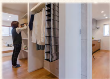
日用品や大きな物でもすっきり収納 大容量の「リビングポケット」