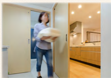
キッチンから約5歩で「洗う→干す」が 効率よく! 家事ラクな「ランドリー動線」