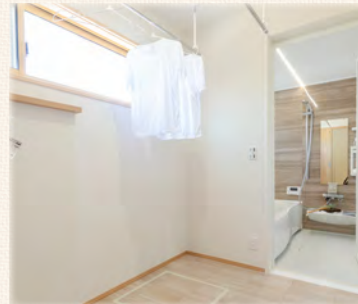
雨の日だって効率よく仕事がこなせる便利なユーティリティスペース。