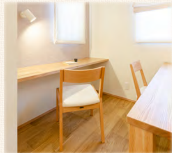
子供のリビング学習にぴったり！キッチン横の「スタディカウンター」