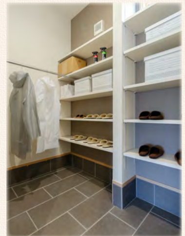
外で使うアイテムも収納できる玄関クロークでいつもスッキリ。