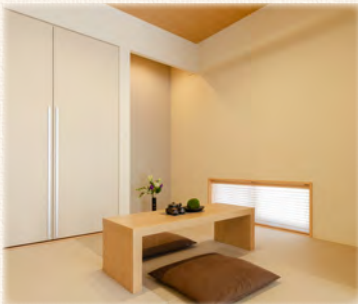
来客時などいろいろ使える、便利な和室。