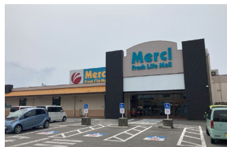
▲ショッピングセンターメルシー