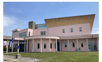
▲国際文化センターカラーレ